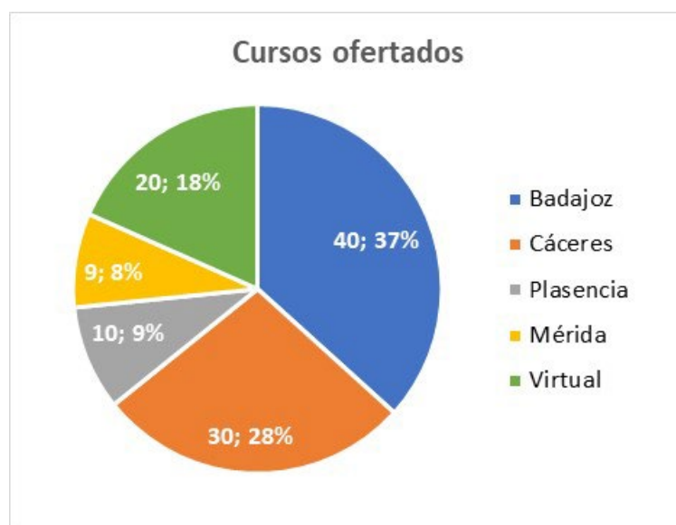
Distribución por sedes del número de cursos ofertados en el Plan de Formación del PDI y PAS del año 2020

Además de estos cursos, también se ha atendido a la solicitud del Grupo G9 de universidades para configurar tres cursos totalmente virtuales atendidos y sufragados por la UEx. Algunos de ellos están todavía en desarrollo y atienden a personal docente de todo el G9.