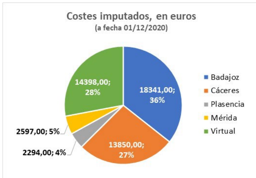
Distribución por sedes de los costes imputados a fecha 01/12/2020 a cargo del Plan de Formación del PDI y PAS

Los talleres acumulan un total de 1645 horas de dedicación (incluyendo presenciales, no presenciales y virtuales) y a ellas han accedido un total de 1453 alumnos. Si atendemos a los solicitantes, el número de solicitudes se multiplica. Las figuras siguientes desglosan los datos por sedes.