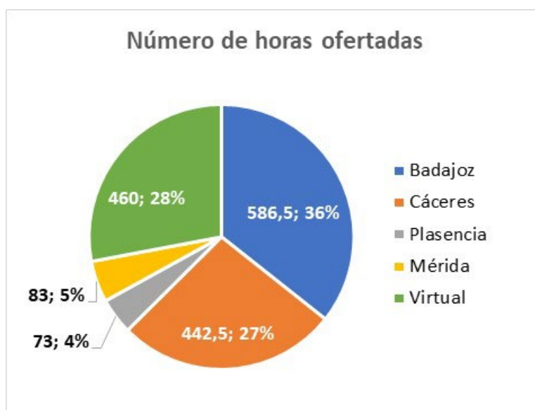
Distribución por sedes del número de horas de formación ofertadas por el SOFD